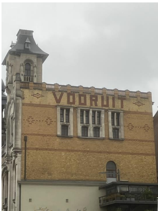
Gebouw De Vooruit aan de Sint-Pietersnieuwstraat 23 in Gent.

‘Vooruit’. Dat viel te lezen op het gebouw in Gent waar het bestuur van de Linschoten-Vereeniging verzamelde voorafgaand aan de boekpresentatie van deel 123 op 18 november jl. Het gebouw fungeert als kunstencentrum. Er zijn een Balzaal, Theaterzaal, Domzaal, Concertzaal en een Café. Sinds 2022 draagt het kunstencentrum echter de naam Viernulvier. 404 verwijst naar een foutmelding die men krijgt als een webpagina onbereikbaar is. Het Gentse kunstencentrum zag zich genoodzaakt een nieuwe naam te zoeken