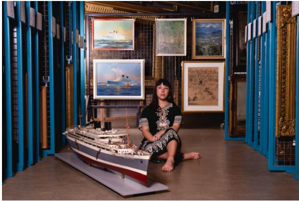
Een van de jonge makers die meewerkte aan de tentoonstelling Verankerd?!

zich in kan herkennen. Zelfs al ben jij niet bekend met migratie over zee, dan nog zul je iets van jezelf terugvinden in deze universele thema's. Of je nu kind bent, of volwassen. Dat was de aanleiding voor het Maritiem Museum om deze tentoonstelling te maken in co-creatie met jonge Rotterdamse makers.