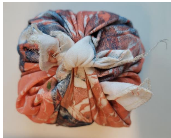
Een bottari door Kimsooja, te zien in Museum De Lakenhal in Leiden.

https://www.lakenhal.nl/nl/verhaal/kimsooja-thread-roots