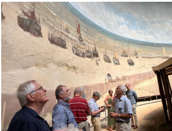
Leden van de Linschoten-Vereeniging worden rondgeleid en bewonderen het 120 meter brede en 14 meter hoge Panorama Mesdag.

Daarna schetste voorzitter Tristan Mostert de 'Voortgang der Werken' met de te verschijnen delen voor de komende jaren.