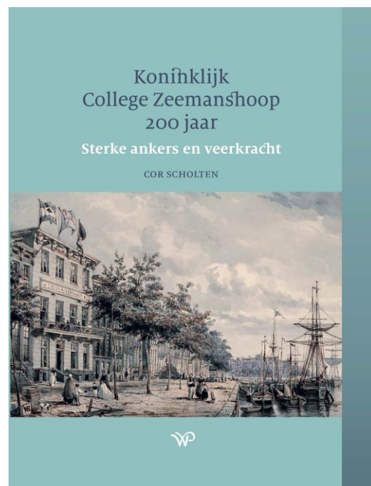
Boekomslag van Koninklijk College Zeemanshoop 200 jaar

Het Koninklijk College Zeemanshoop bestond in mei 2022 precies 200 jaar, maar het jubileumboek kon toen nog niet worden gepresenteerd. Het door Cor Scholten geschreven boek is met zijn bijna 300 pagina's met recht een monument voor het Koninklijk College Zeemanshoop, gesticht als humanitaire instelling om zeelieden bij invaliditeit te ondersteunen of, bij overlijden, hun weduwen en kinderen. Daarnaast was een tweede functie 'de bevordering van den bloei der Nederlandsche zeevaart'. Diverse activiteiten volgden hieruit, zoals het opzetten van een vakbibliotheek voor de leden en het doen van voorstellen op zeevaartgebied aan de regering. Door al die initiatieven werd Zeemanshoop een centraal ontmoetingspunt voor scheepvaartbelangen. Bij het 150-jarig bestaan in 1872 kreeg het Zeemanshoop het predicaat Koninklijk.