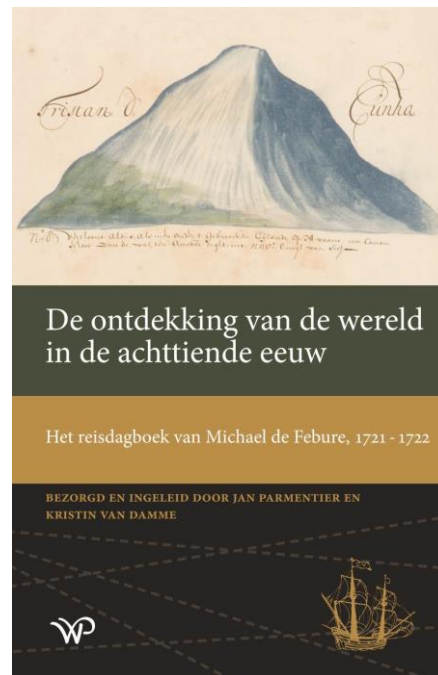
Boekomslag van deel 123, Een ontdekking van de wereld in de achttiende eeuw