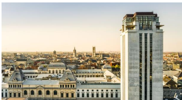
De Boekentoren van de Gentse universiteitsbibliotheek, naar een ontwerp van Henry Van de Velde

Dit is de tweede en alweer laatste nieuwsbrief van de Linschoten-Vereeniging van 2023. Na een zeer druk verenigingsjaar in 2022 met drie boekpresentaties konden het bestuur en de leden dit jaar even bijkomen. We liggen met de uitgaven nu weliswaar weer op schema, maar stilzitten doen we natuurlijk niet! Voor dit najaar staat weer een mooi en bijzonder deel op de rol. In deze nieuwsbrief vindt u er meer over. Het bestuur is altijd op zoek naar bijzondere locaties en deze keer gaan we naar Gent in Vlaanderen!